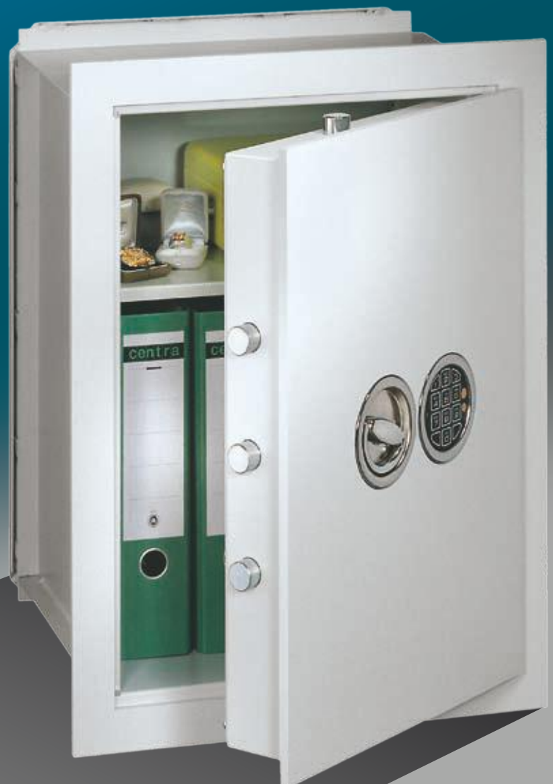
Abb.: VCO 6 (mit Sonderausstattung EZ LG Basic versenkt)