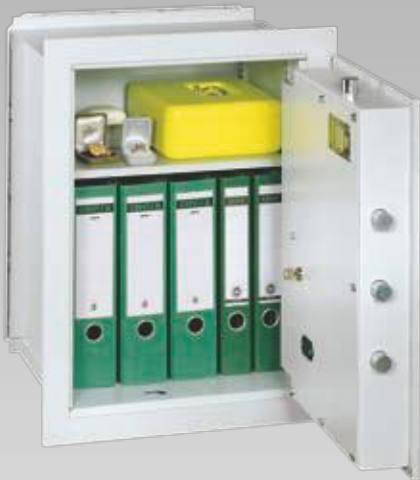
Abb.: VCO 6