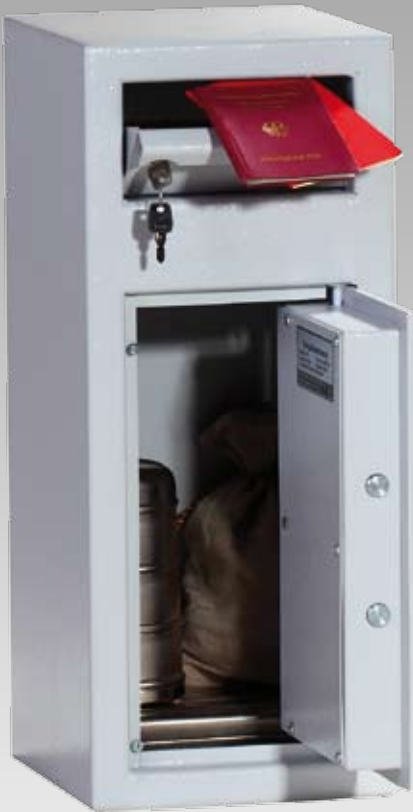
Abb.: MPT 1