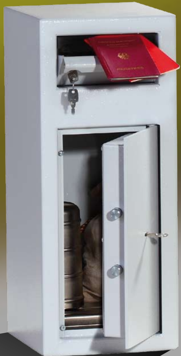
Abb.: MPT 1

verschiebbare Einwurflappe mit Rückholsicherung