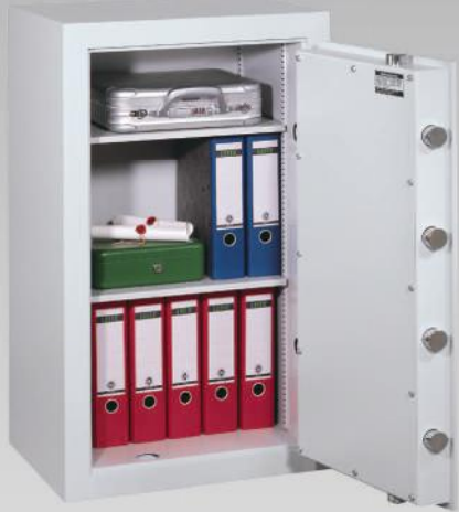
Abb.: GT 100 S