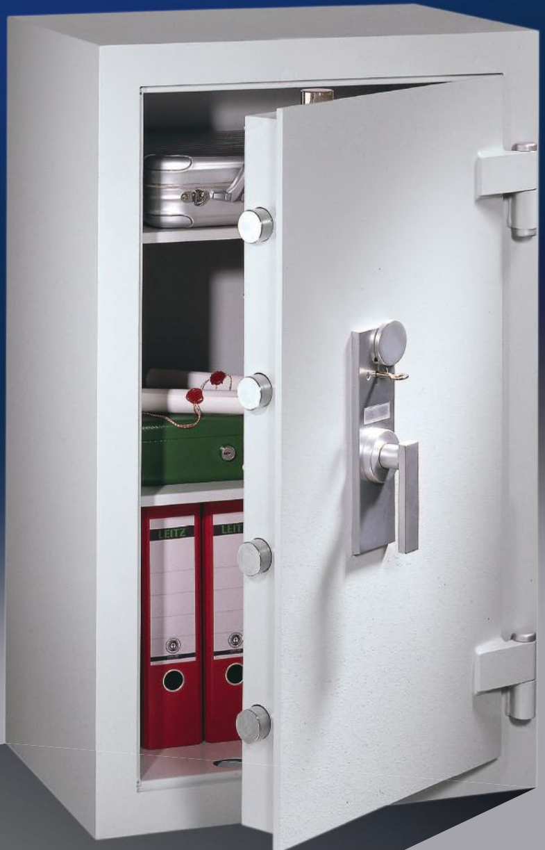
Abb.: GT 100

Fachböden ordnertief; rundum doppelwandig, starke Bolzen