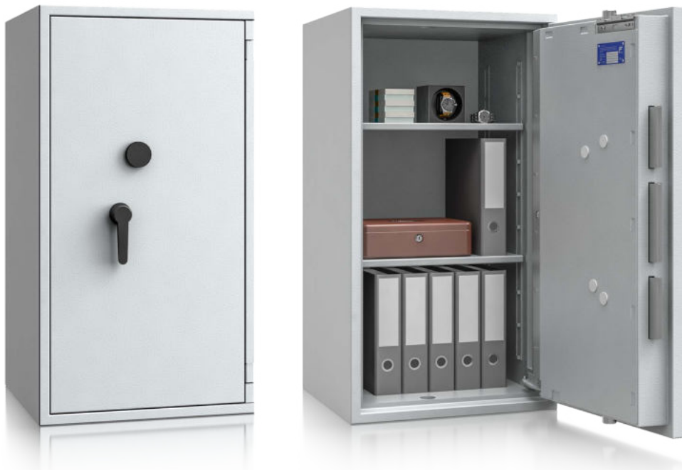
Modell EW III-105