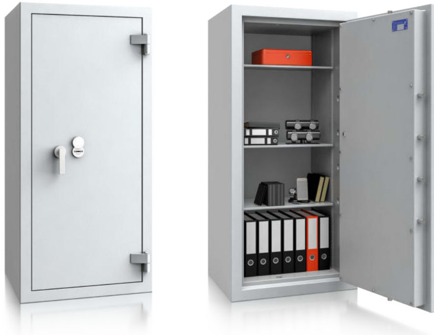
Modell EN I-160