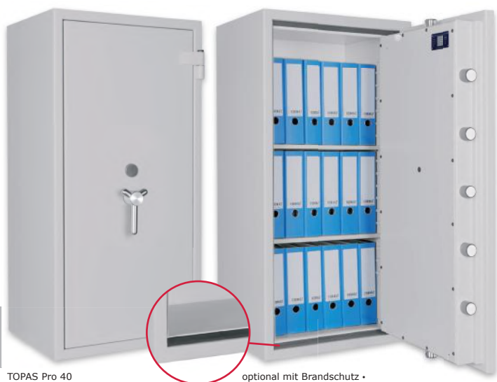
TOPAS Pro 40 Lichtgrau • light grey Dekoration nicht im Lieferumfang enthalten • decoration not included in the delivery

Wertschutzschrank, Grad II (EN 1143-1) Safe, Grade II (EN 1143-1)