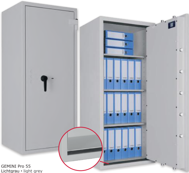
GEMINI Pro 55 Lichtgrau • light grey Dekoration nicht im Lieferumfang enthalten • decoration not included in the delivery

Wertschutzschrank, Grad I (EN 1143-1) Safe, Grade I (EN 1143-1)