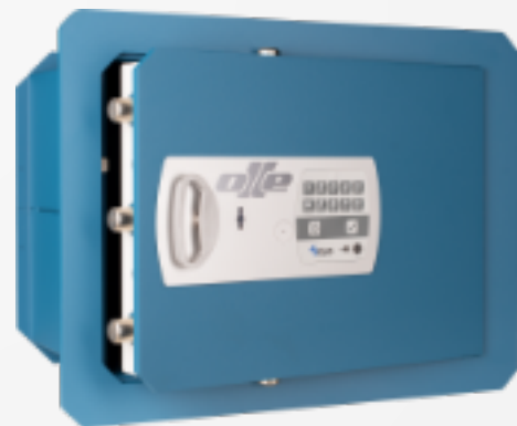
wall 802-25 OCLUC