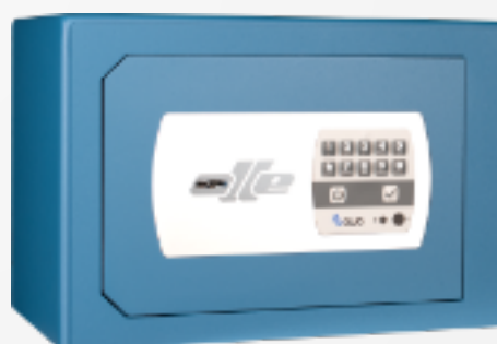
smart 801 OCLUC